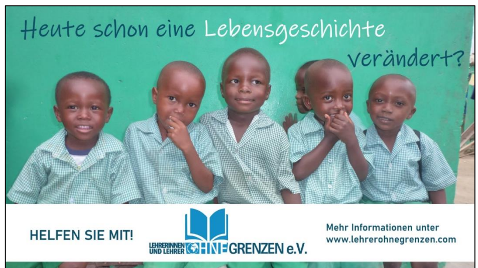
Vereinsdarstellung auf dem LED-Screen in der Gökerstraße, Wilhelmshaven

Die Frage findet sich aktuell auch im Rahmen einer Werbekampagne für unseren Verein wieder. Wir danken dem Medienhaus Wilhelmshaven für die Möglichkeit, über einen großen LED-Screen in der Stadt auf unseren Verein aufmerksam machen zu dürfen.